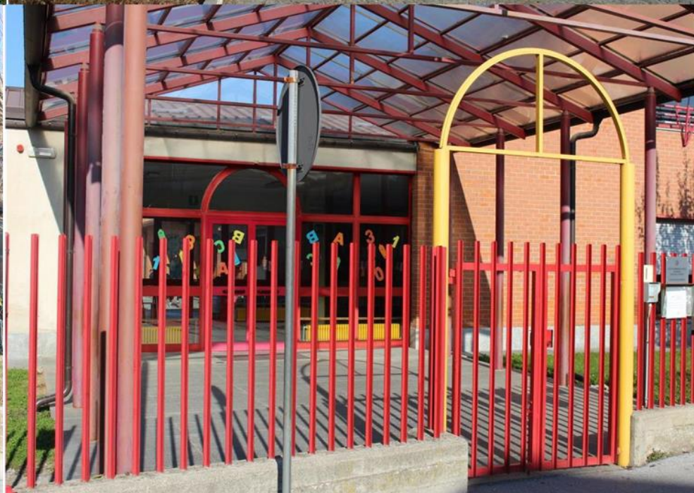
ISTITUTO COMPRENSIVO STATALE "A.Vassallo" BOVES Via Don Cavallera, 14 BOVES (CN)