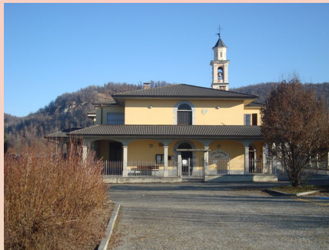
SCUOLA PRIMARIA RIVOIRA

L'Istituto Comprensivo è costituito da tre plessi di scuola primaria