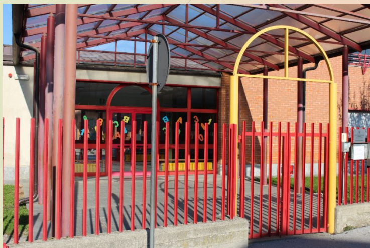
SCUOLA PRIMARIA BOVES CAPOLUOGO

L'Istituto Comprensivo è costituito da tre plessi di scuola primaria