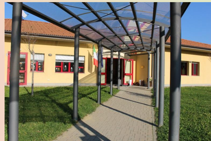
SCUOLA PRIMARIA FONTANELLE