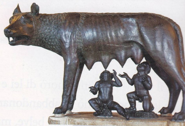
La Lupa, il simbolo di Roma. Secondo la leggenda, allattava Romolo e Remo, due gemelli.